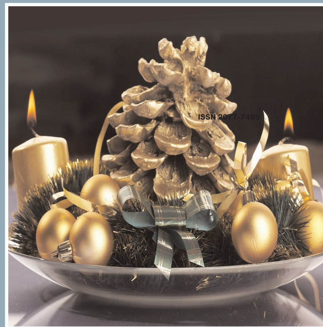
www.dovkil-zdorov.kiev.ua ISSN 2077-7485