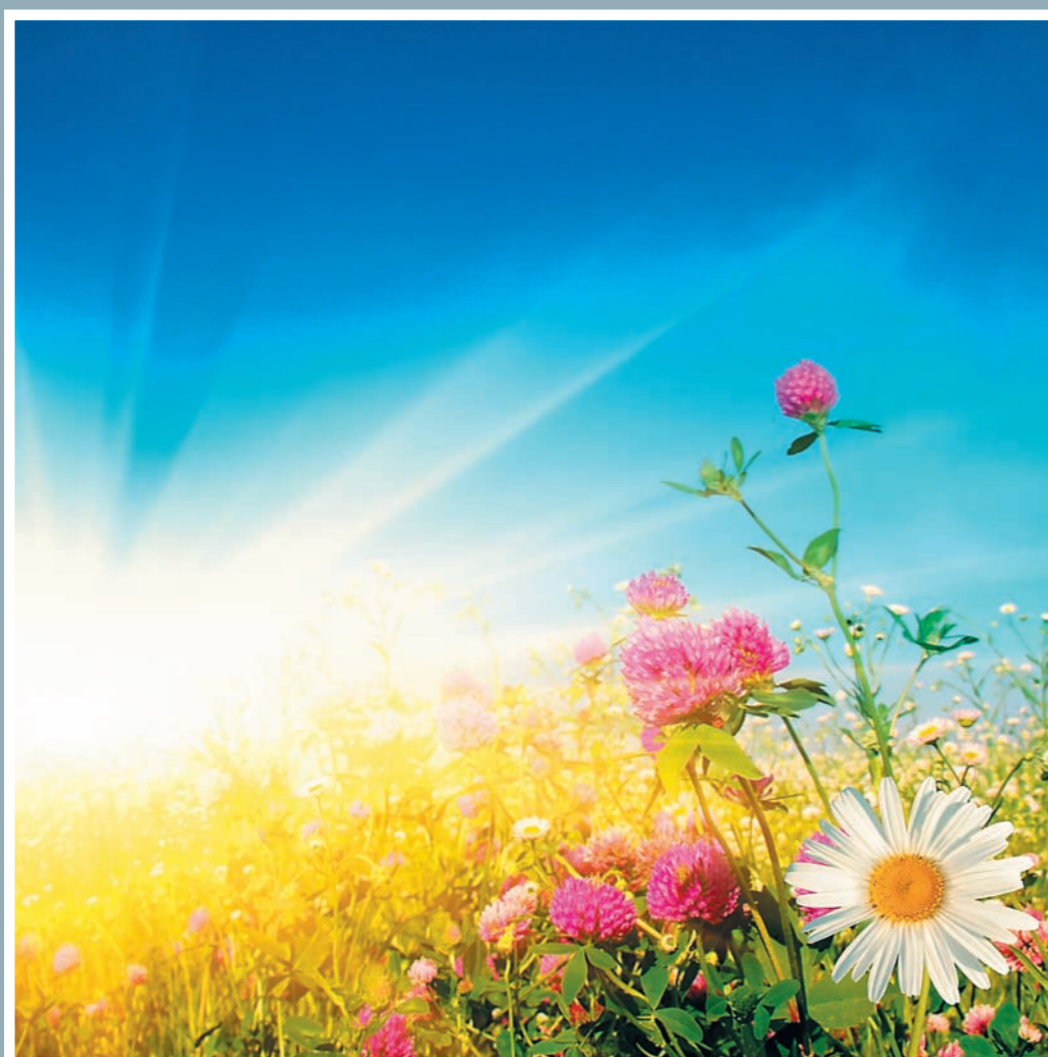
Передплатний індекс 74110